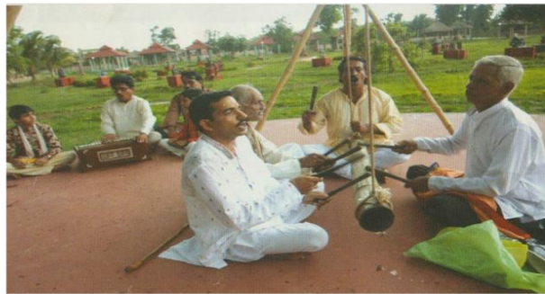
EZCC ଆନୁକୂଲ୍ୟରେ ଆୟୋଜିତ ଗୁରୁଶିଷ୍ୟ ପରମ୍ପରା କାର୍ଯ୍ୟକ୍ରମରେ ଭୂମ୍ପା ପରିବେଷଣ