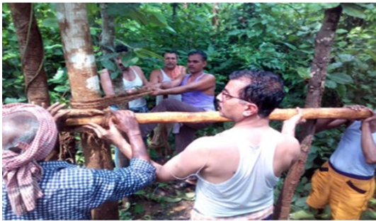
ଭୂମ୍ପା ବାଦ୍ୟର କରିବାର କୌଶଳ