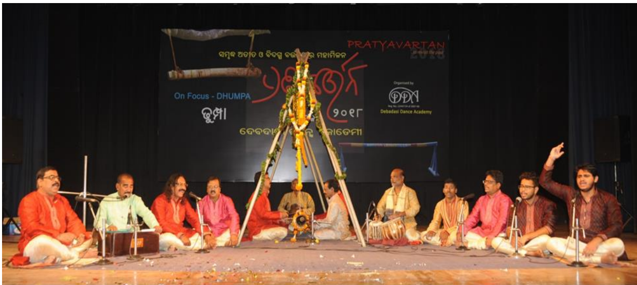
ଭୂମ୍ପା ପରିବେଷଣ ସମୟର ଦୃଶ୍ୟ