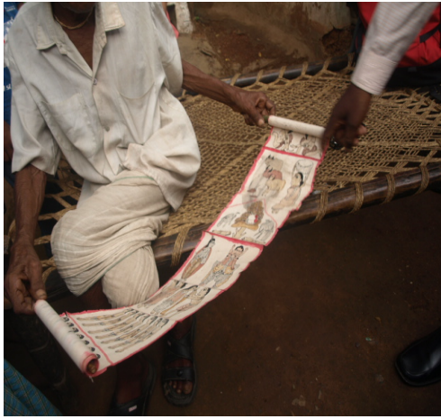
ପ୍ରଜାତିକ ପ୍ରତିନିଧି: ପଚୁଆ (ସାନ୍ତାଳୀ)

ମେଲାଭୁତିଆର, ଜଲଜିଆ, ସିଆନ, ଜାନୀ, ଝାଁକର, ଦିଆରି, ଗୁନିଆଁ, ଦେହେଲିଆ ପ୍ରଭୃତି ଓ ଘୋରିଆ, ପରଘନିଆ, ଭଗୁଆ, ମରାଲ, ବିରଥୁଆ ଆଦି ପ୍ରଜାତିକ ଭାତ, ଏମାନଙ୍କ ପରିବାରର ମହିଳାମାନେ ମଧ୍ୟ କଥାନ୍ତି ପରିବେଷଣ କରିଥାନ୍ତି ।