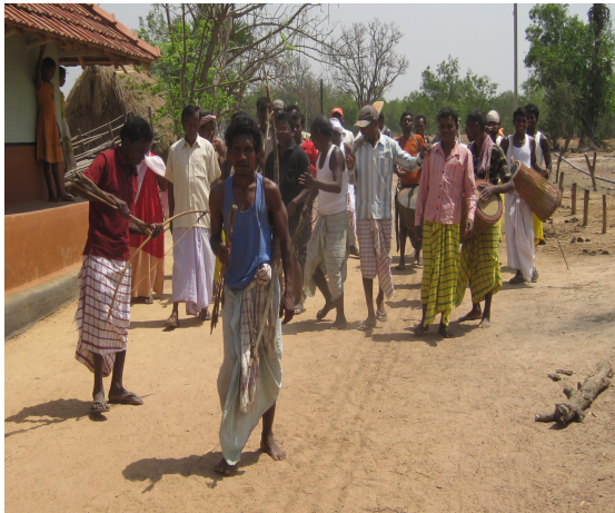
ସାନ୍ତାଳ ଗୋଷ୍ଠୀର ବାହା ପରବ ପରବର୍ତ୍ତୀ ଶିକାର ଯାତ୍ରା: ବାଜା ଓ ବଜନିଆଙ୍କ ଭୂମିକା

କେବଳ ନାଚ ନୁହେଁ ଆଦିବାସୀ ଓ ମିତାନ୍ ଗୋଷ୍ଠୀରେ ଗୀତର ମଧ୍ୟ ଭଲେଖନୀୟ ଭୂମିକା ଦେଖିବାକୁ ମିଳେ । ଜାତି, ଧର୍ମ, ଗୋଷ୍ଠୀ, ବୟସ ନିର୍ବିଶେଷରେ ସମସ୍ତ ଗୋଷ୍ଠୀର ପ୍ରାୟ ଉଣାଅଧିକେ ସଦସ୍ୟ ନିଜନିଜ ପରିବେଶରେ କିଛି ନା କିଛି ଗୀତ ପରିବେଷଣ କରିଥାନ୍ତି । ଜନ୍ମ, ବିବାହ, ମୃତ୍ୟୁ-ପରବର୍ତ୍ତୀ ବିଶେଷ ସଂସ୍କାର, ନାଚ, କୃଷି, ଧାନକୁଟା, ଧାନ ଅମଳ, ପିଲାବୁଝା, ଦେବୀଦେବତା ଆବାହନ, ପରବ ପାଳନ ଆଦି ପାଳନ ସମୟରେ ଗୀତ ଗାନ କରିବା ଦେଖାଯାଏ । ତେବେ, ବିଶେଷ ଅନୁଷ୍ଠାନ ମାନଙ୍କରେ ନିୟମିତ ଗୀତ ପରିବେଷଣକାରୀ ସାଧାରଣତଃ ଗୀତକୁଟିଏନ, ଗୀତକୁଟିଆ ଭାବରେ ପରିଚିତ । ସେହିପରି, ଗୀତଗୁଡ଼ିକ ବିଶେଷ ଆୟୋଜନରେ, ନୃତ୍ୟ ପରିବେଷଣରେ, ପର୍ବପର୍ବାଣିରେ, ଦୀର୍ଘ ସମୟ ଧରି କରାଯାଉଥିବା ଶ୍ରମରେ ଶ୍ରମ ଲାଭ ପାଇଁ ଉଦ୍‌ଘୋଷଣ ସ୍ଵରୂପ, ହଳ କଳା ବେଳେ (ବୋରିଆ, ସଜନୀ, ଜାଲଫୁଲ ଆଦି), ବିବାହର କେତେକ କ୍ରିୟାକର୍ମ ସମ୍ପାଦନ ସମୟରେ କିଛି ଗୋଷ୍ଠୀରେ ମୃତ ସମ୍ପର୍କିତ ବିଶେଷ କର୍ମ ସମୟରେ (ଭୂମିଜଳ ହାଲାର ଉତ୍ତୁଂ, ଗଣ୍ଡମାନଙ୍କ ମାଣ୍ଡଳପାଟା, ଓ ଗାଦବାମାନଙ୍କ ଗତର), କେତେକ ପାରମ୍ପରିକ ଜ୍ଞାତା ପରିବେଷଣ କଲାବେଳେ (ବୋରିଆ, ପୁଟି, ଚଢ଼ିଆ ଛନେ ଦିଅ), ତଥା ପିଲା ବୁଝାଇବାକୁ ଯାଇ ମଧ୍ୟ ଘରର ବୟସ୍କ ସଦସ୍ୟ ଗୀତ ପରିବେଷଣ କରିବା ଦେଖାଯାଏ । ସେହିପରି, ଭୁଞ୍ଜିଆ ଗୋଷ୍ଠୀରେ ବିବାହ ସମୟରେ ଦେବୀଦେବତାଙ୍କୁ ସୁମରଣା କରିବା, ହଳଦୀ ଲଗାଇବା, ଗନସନ୍, ଓଲଗାନ୍ (ନିଜ ଗୋଷ୍ଠୀର ବିଭିନ୍ନ ସଦସ୍ୟଙ୍କୁ ପ୍ରଣାମ କରି ଆଶୀର୍ବାଦ ନେବା) ଆଦି ସମୟରେ ଧରମ ଡାକରା ଗୀତ, ହରଦୀଗରଦୀ ଗୀତ, ଗୁଞ୍ଜାରେନ୍ ଗୀତ, ତଥା ଓଲଗାନ୍ ଗୀତ ଆଦି ପରିବେଷଣ କରିବା ଦେଖାଯାଏ । କେବଳ ଭୁଞ୍ଜିଆ ଗୋଷ୍ଠୀ ନୁହନ୍ତି ଅନ୍ୟ ଆଦିବାସୀ ତଥା ମିତାନ୍ ଗୋଷ୍ଠୀରେ ମଧ୍ୟ ଜନ୍ମ ବିବାହ ତଥା ବିଭିନ୍ନ ପର୍ବପର୍ବାଣି ସମୟରେ ଗୀତ ଓ ନୃତ୍ୟର ପରିବେଷଣ ଦୁର୍ଲ୍ଲଭ ନୁହେଁ । ଏହି ଗୀତକୁଟିଏନ, ଗୀତକୁଟିଆମାନେ କଥାନ୍ତି ମଧ୍ୟ ପରିବେଷଣ କରିଥାନ୍ତି । ଏମାନଙ୍କ ବ୍ୟତୀତ ସାମାଜିକ ସାଂସ୍କୃତିକ ପ୍ରତିନିଧି ଚହଲିଆ, ସୁତରେନ୍,