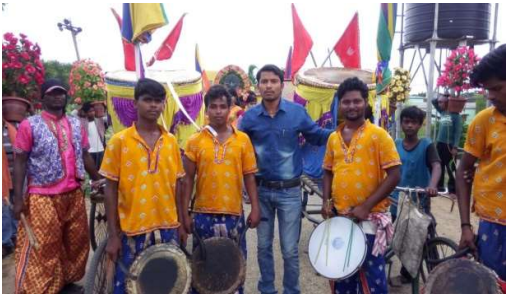
ଫଟୋ ସଂ. ୬. ନିଶାଣ ନାଚ

ନିଶାଣ ବାଜା ନାଚକୁ ବୀର ବାଜା ନାଚ କୁହାଯାଏ । ଏହି ନୃତ୍ୟର ଆରମ୍ଭ ପ୍ରତିବର୍ଷ ଭାଦ୍ରବ ମାସରୁ ହୋଇଥାଏ । ଅଧିଷ୍ଠାତ୍ରୀ ଦେବୀ ମାଆ ଦୁର୍ଗାଙ୍କ ପୂଜାରେ ଏହି ବାଦ୍ୟ ନୃତ୍ୟର ଶୁଭାରମ୍ଭ ହୋଇଥାଏ । ଏହି ବାଦ୍ୟ ଯନ୍ତ୍ର ସହିତ ବୀର କାହାଳୀ, ମହୁରୀ, ଢୋଲ ସହ ତାଳ ଏକ ହଳ ବ୍ୟବହାର ମଧ୍ୟ ହୋଇଥାଏ । ତାଳତେରର ଅଧିଷ୍ଠାତ୍ରୀ ଦେବୀ ମାଆ ହିଙ୍ଗୁଳାଙ୍କ ପୀଠରେ ମାଆଙ୍କ ପୂଜା ସମୟରେ ଏହି ନୃତ୍ୟର ବେଶ ଆକର୍ଷଣ ରହିଛି ।