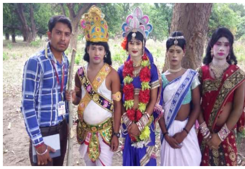
ଫଟୋ ସଂ. ୭. ବଣ୍ଡିନାଚ

ବଣ୍ଡିନୃତ୍ୟ ଏକ ପୌରାଣିକ ବିଷୟବସ୍ତୁ ଉପରେ ଆଧାରିତ । ଉଚ୍ଚ ନୃତ୍ୟରେ ବଣ୍ଡି ଚରିତ୍ରଟି ଏକ ଖଳ ଚରିତ୍ର । ବଣ୍ଡି ହେଉଛି ଚନ୍ଦ୍ରସେଣାର ଭଉଣୀ । ରାଧାକୃଷ୍ଣ, ଚନ୍ଦ୍ରସେଣା ଓ ତାର ମାଆ ଜଟିଳା ବୁଢ଼ୀ ଉଚ୍ଚ ନାଚରେ ଅଂଶ ଗ୍ରହଣ କରନ୍ତି । ବଣ୍ଡି ଚରିତ୍ରଟି ରାଧାକୃଷ୍ଣଙ୍କ ପ୍ରେମ ସଂପର୍କକୁ ନେଇ କଳହ ସୃଷ୍ଟି କରେ ମାଆ ଜଟିଳା ଓ ଭାଇ ଚନ୍ଦ୍ରସେଣା ପାଖରେ । ବାଦ୍ୟଯନ୍ତ୍ର, ଆଲୋକ, ଗୀତ ଓ ସଂଳାପ ବ୍ୟବହାର କରାଯାଇ ନୃତ୍ୟଟିକୁ ରୋମାଞ୍ଚକର କରାଯାଏ । ଏହି ନୃତ୍ୟ ସାଧାରଣତଃ ସାନଯୋରତା ଓ ବାଦିବାହଳ ଅଞ୍ଚଳରେ ବହୁଳ ଭାବରେ ଦେଖାଯାଏ ।