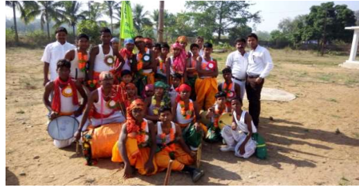
ଫଟୋ ସଂ. ୪. ପାଇକ ନାଚ

କରୁଥିଲେ । ନିଜ ବୀରତ୍ୱକୁ ପ୍ରଦର୍ଶନ କରିବା ପାଇଁ ରାଜାଙ୍କ ସମ୍ମୁଖରେ ପାଇକ ପୁଅ ଖଣ୍ଡା ଖେଳ ନାଚ ପ୍ରଦର୍ଶନ କରିଥାନ୍ତି । ଦଶହରା ପର୍ବରେ ମାଆ ଦୁର୍ଗାଙ୍କ ପାଖରେ ପାଇକ ପୁଅ ଅସ୍ତ୍ର ପୂଜା କରି ସିନ୍ଦୂର ଚିକା ମାରି ମଥାରେ ପଗଡ଼ି ଓ ଧୋତି ପିନ୍ଧି ଖେଳ ପଡ଼ିଥାରେ ଏହି ନାଚ ପ୍ରଦର୍ଶନ କରିଥାନ୍ତି । ଏହି ପାଇକମାନଙ୍କର ନାଚ ଓଡ଼ିଆମାନଙ୍କ ବୀରତ୍ୱର ଗାଥା କହିଥାଏ । ଏହି ଯୁଦ୍ଧକାଳୀନ ସମର ନୃତ୍ୟ ବୁଢ଼ାପଙ୍କ, ବଳରାମ ପ୍ରସାଦ ଏବଂ ସମଲ ଆଦି ଅଞ୍ଚଳରେ ବିଶେଷ ଭାବେ ଦେଖାଯାଏ ।