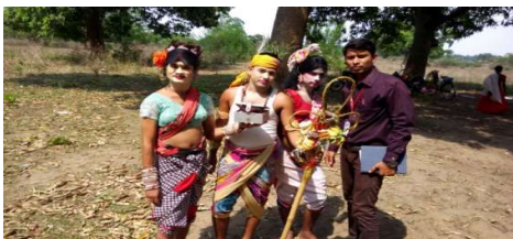
ଫଟୋ ସଂ. ୨. ଚଢ଼େୟା ଚଢ଼େୟାଣୀ ନାଚ

ଓଡ଼ିଶାର ଅନୁଗୋଳ ଓ ବାଲେଶ୍ଵର ଜିଲ୍ଲାରେ ଏହି ନାଚ ସର୍ବାଧିକ ଜନପ୍ରିୟ ହୋଇଛି । ଚଢ଼େୟା ଚଢ଼େୟାଣୀକୁ ଗୀତ ଓ ନୃତ୍ୟ ମାଧ୍ୟମରେ ପ୍ରକାଶିତ କରାଯାଏ । କୌଣସି କାରଣରୁ ସର୍ପାଘାତରେ ଚଢ଼େୟାର ମୃତ୍ୟୁ ଓ ଚଢ଼େୟାଣୀର ଶୋକ ଏବଂ ପରବର୍ତ୍ତୀ ଅବସ୍ଥାରେ ହର-ପାର୍ବତୀଙ୍କ ଦୟାରୁ ଚଢ଼େୟାର ପୁନଃ ଜୀବନ ପ୍ରାପ୍ତି ଏହି ମିଳନାତ୍ମକ ପରସ୍ପତିରେ ପରିସମାପ୍ତି ଘଟାଇଥାଏ । ଚଢ଼େୟା-ଚଢ଼େୟାଣୀ ନୃତ୍ୟର ମଧ୍ୟରେ ଆଉ ଜଣେ ତୃତୀୟ ଚରିତ୍ର ଗୀତକୁ ଗଦ୍ୟ ମାଧ୍ୟମରେ ବିଶ୍ଳେଷଣ କରି ବୁଝାଇ ଦେଇଥାଏ । ଏହି ତୃତୀୟ ଚରିତ୍ର ଏକ ପ୍ରଶ୍ନକତାର ଭୂମିକା ନେଇ ହାସ୍ୟ ଓ ନୃତ୍ୟ ପରିବେଷଣ କରିଥାଏ । ଏହି ନୃତ୍ୟ ଜିଲ୍ଲାର ଲକେଇପଶି, ଗୋବରା ଏବଂ ଧର୍ମପୁର ଅଦି ଗ୍ରାମରେ ବେଶ ଆଦୃତ ।