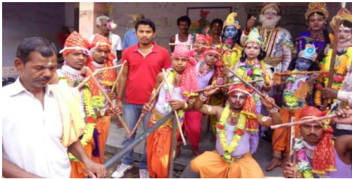
ଫଟୋ ସଂ. ୩. ଲଭତି ନାଚ